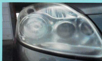
レンズ面のくもり