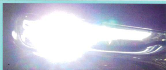
対向車のまぶしいヘッドライト