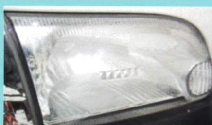
内部リフレクタの劣化